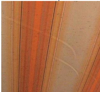
Uitrekken / doorhangen